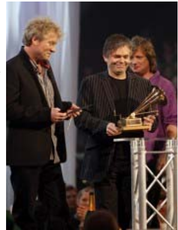
Vamp har vunnet fire Spellemannpriser.