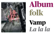
Album folk Vamp La la la

4 Solid nytt album fra et band i stadig utvikling.