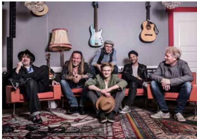
I forbindelse med sitt nye album har Vamp kommet opp med AlbumBoka . En trykt bok i vinylsingel-format, som et supplement for dem som kun benytter seg av strømmetjenester.

Det som først fremstår som mindre kraftfullt, skjuler en enorm energi som kombineres med en leken nyanserikdom. Og med ett forenes de ofte lekne og underfundige fortellingene med et smittende musikalsk smil.